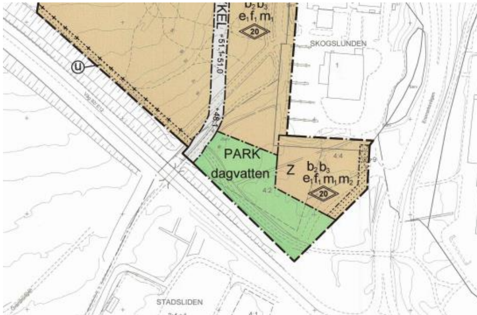
Utsnitt ur gällande detaljplan 2480K-P2020/14