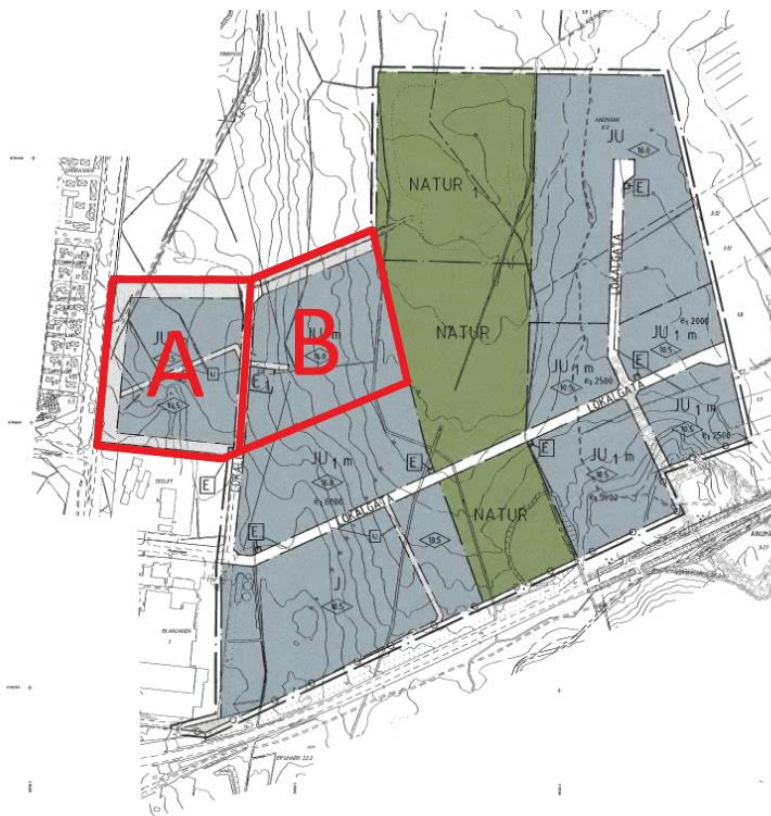
Figur 4. Urklipp från gällande detaljplan.

Nedan listas ett antal viktiga punkter som gäller för etapp 1, hela detaljplanen finns att studera på: https://lm.umea.se/kip/djvu/P12_2.djvu