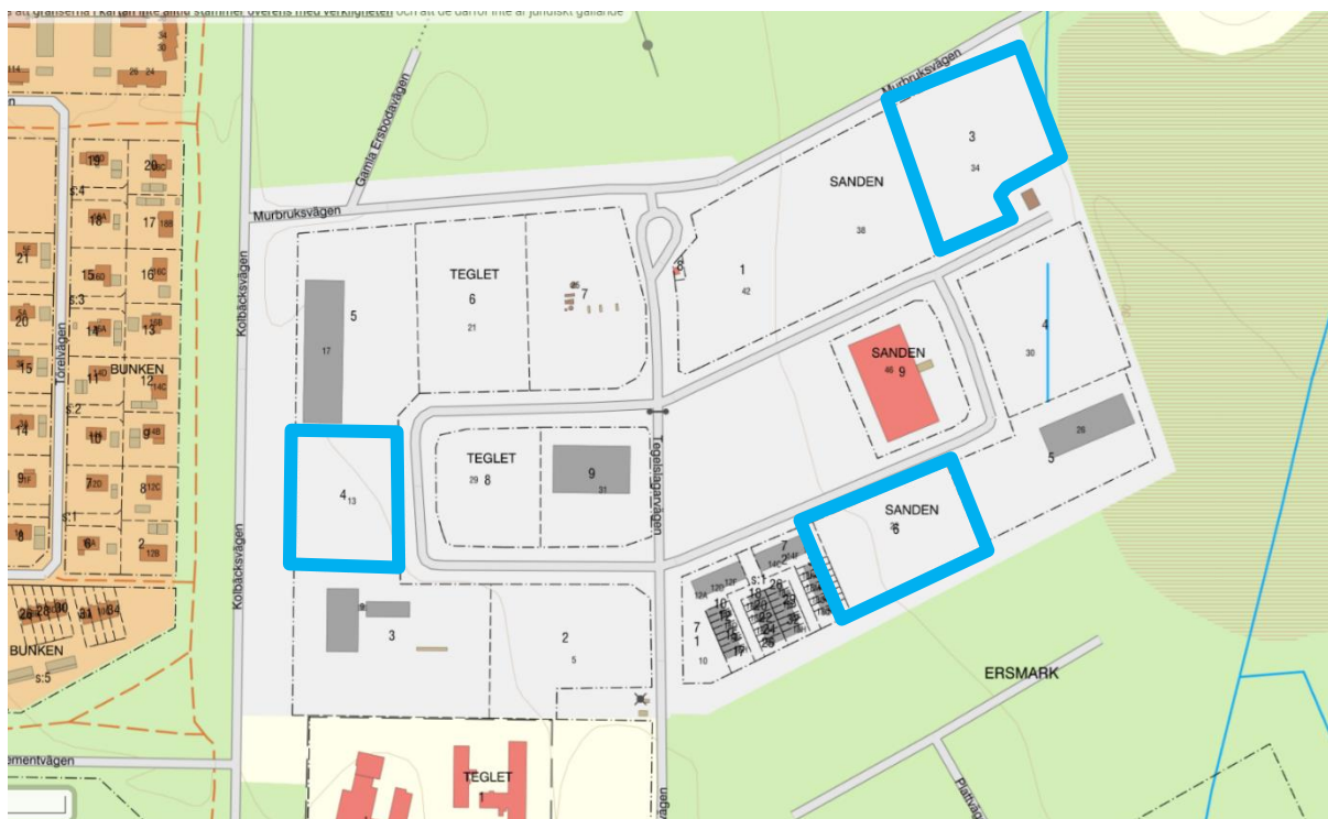
Figur 3. Karta över fastighetsindelning. Fastigheter markerade med blå kantlinje är tillgängliga. Övriga fastigheter är reserverade, köpta eller bebyggda.