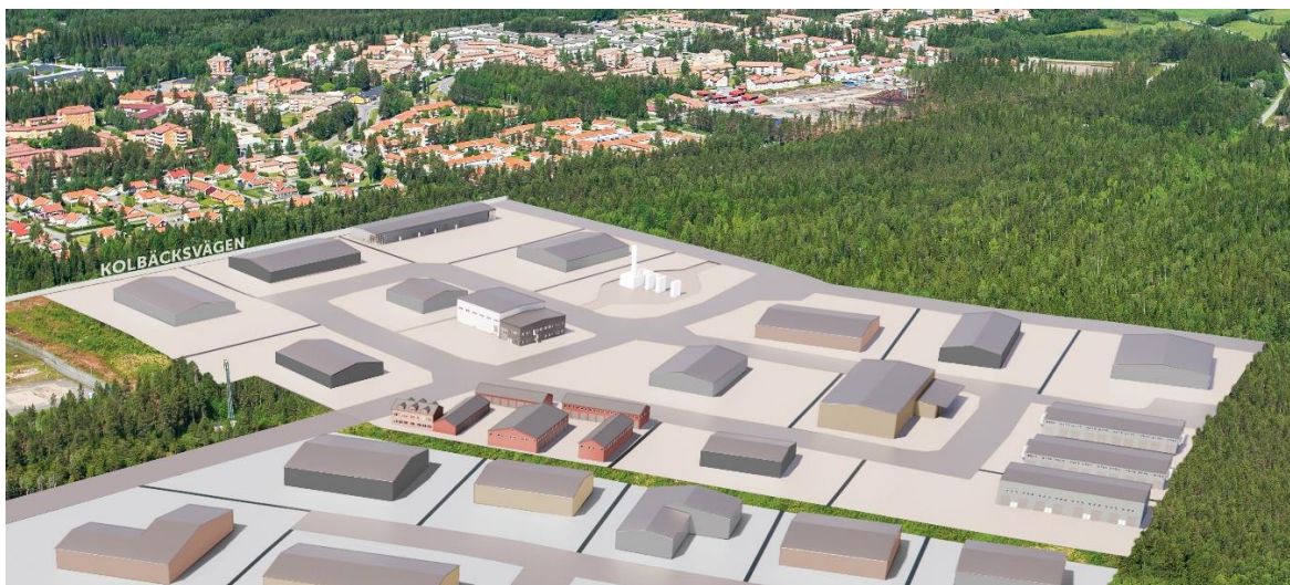
Figur 5. Illustration tänkt för byggnation av Östra Ersboda etapp 1. OBS! Illustrationen ska ses som en helhet och inte som en skiss för varje enskild fastighet.