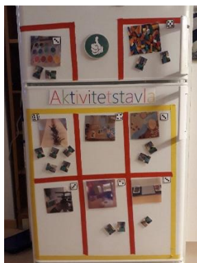
Exempel på valtavla/aktivitetstavla