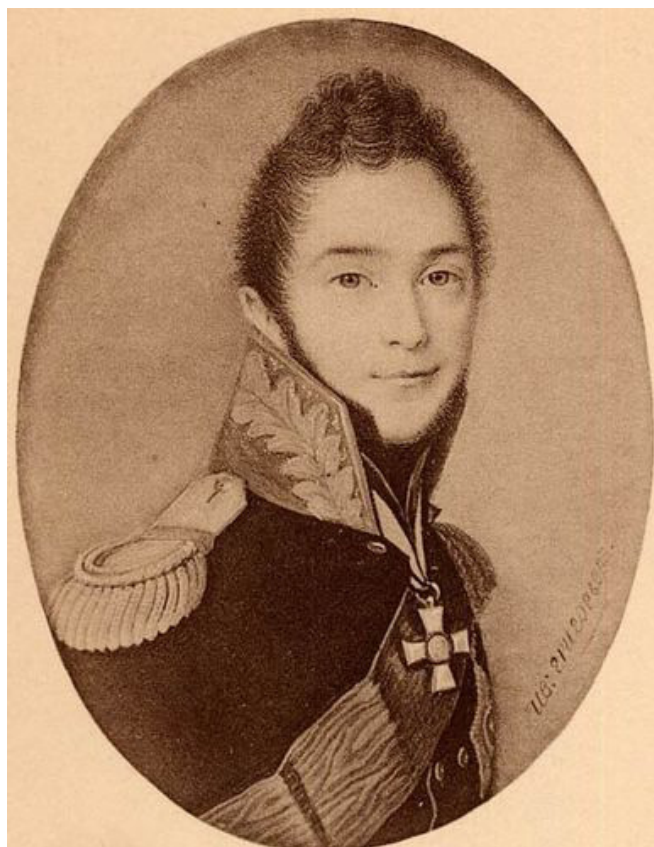
Графъ Николай Михайловичъ Каменскій, 1776 — 1811

Det samiska skulle emellertid dröja, inte ett helt sekel men närapå. Inom EU-projektet »De nordliga kulturtraditionerna« byggdes tre samiska visten på en del av området som fortfarande har karaktär av barrskog. I mars 2011 invigdes hela visteområdet med nybyggen efter förebilder i Sápmi – sydsamiskt, skogssamiskt och nordsamiskt viste.