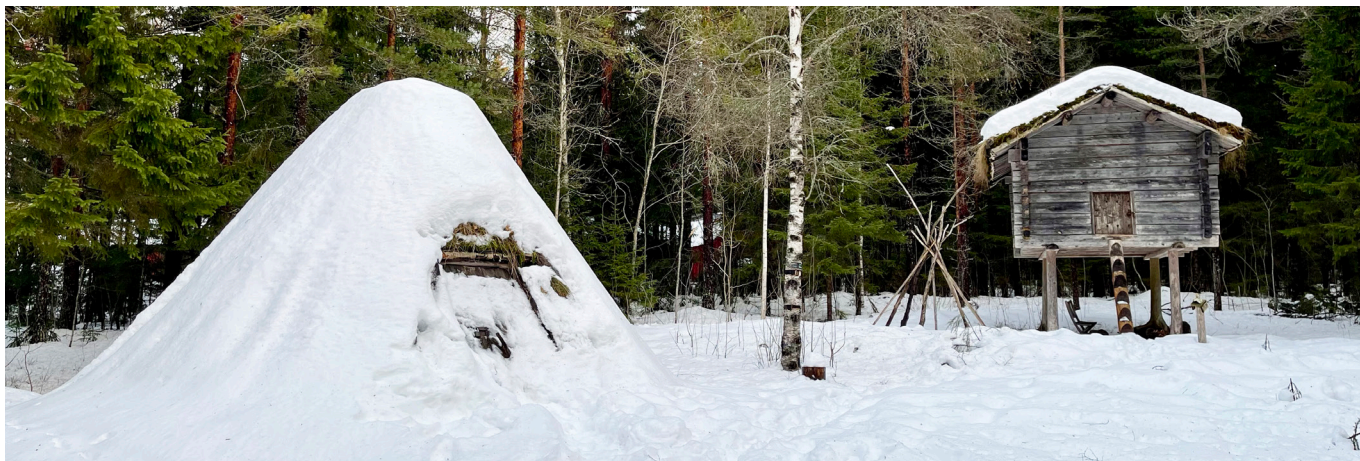
Sydsamiskt viste vid Gammlia, uppfört 2009. Vistet är inspirerat av Sigvard Klemetssons Suskaseviste nordväst om sjön Vuokarni Vilhelmina kommun.

Läs mer via https://www.yumpu.com/sv/document/read/35586752/sydsamisk-vasterbottens-museum