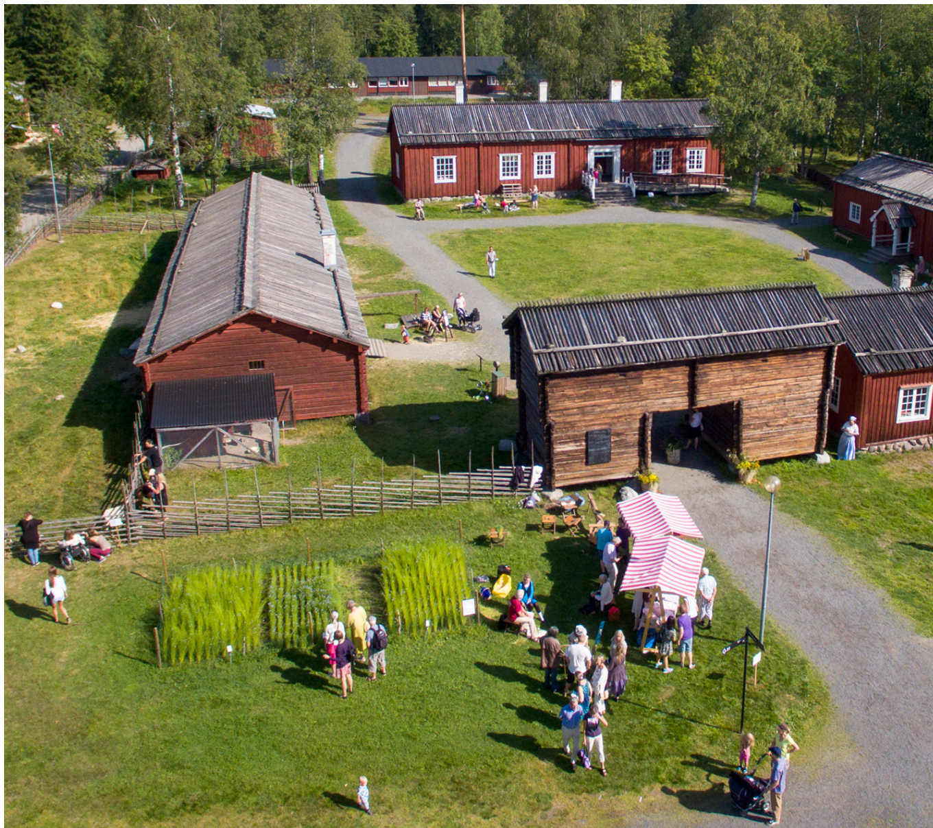
Del av friluftsområdet Gammlia i Umeå.