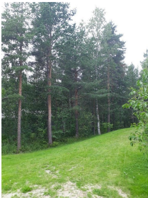
Bild 2. Del av kvarlämnad skog på bfr:ens tomtmark som ansluter till parkmarkskorridoren utanför föreningen.