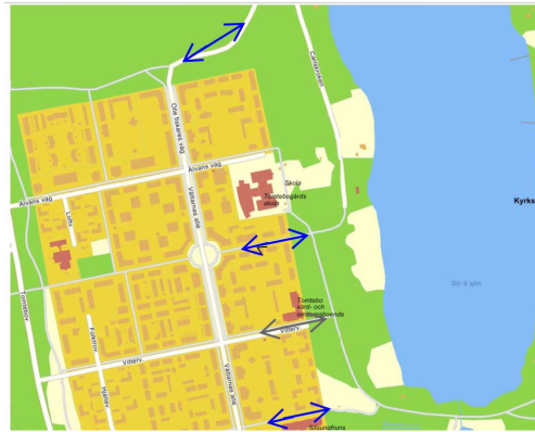
Figur 2. Kartskiss GC-stråk till Nydalasjön.

Det är ca 300 m mellan dessa (bilfria) förbindelsestråk. Norr om gamla Tomtebo ges en unik möjlighet att skapa/bibehålla en av dessa förbindelser upp till Nydalasjön, där även naturmark/parkmark kan sätta sin prägel på området mellan stadsdelarna. I översiktsplanen, se Figur 1 ovan, redovisas ett parkområde söder om Tomtebostrand som är tillräckligt stort för att ge möjlighet att skapa en sådan grön förbindelse, som även skulle inneha en ekologisk funktion, med en koppling från skogsområdet kring Grössjön i söder och upp till skogs-/strandområdet vid Nydalasjön, se Figur 3 nedan.