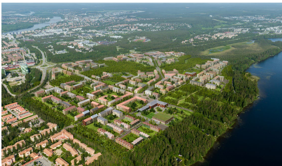
Illustrerad flygbild över Tomtebo strand, White arkitekter

Inom grönkorridoren kommer skog och natur att sparas i så hög utsträckning som möjligt. Kommunen kommer göra ekologiska passager i form av broar, så det blir mindre eller inga vandringshinder för växt- och djurlivet inom grönkorridoren. Förslaget tar också höjd för lokalt omhändertagande av dagvatten inom planområdet så att vattnet kommer fördröjas och renas lokalt inom planområdet och därmed inte påverka varken Kolbäcken nedströms eller Nydalasjön. Därutöver sparas en minst 30 meter bred kantzons till Kolbäcken, där ingen påverkan kommer att ske i bäckfåran för att bäcken inte ska påverkas negativt av exploateringen.