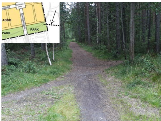
Bild 1. Stig mot Nydalasjön från Olle Fiskares väg

Fiskares väg viker av mot norr. Stigen kommer dessutom med all sannolikhet vara än mer använd än den som visas på bilden.