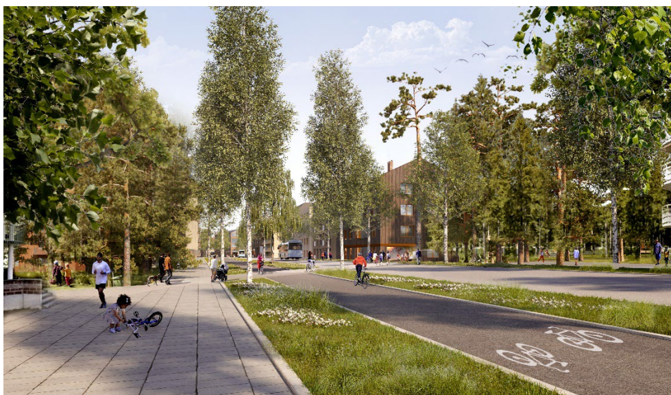
Illustration med vy från befintliga Tomtebo längs förlängningen av Vättarnas allé

För att bemöta denna synpunkt har området mellan befintliga Tomtebo och Tomtebo strand utökats efter samrådet. Ett bredare område gör att mer befintlig skog kan sparas och ett utvecklat parkstråk kan rymma både ett generöst gång- och cykelstråk samt dagvattenhantering. Av den anledningen har planförslaget reviderats till att ha ett avstånd för park, gång och cykel på 36 meter från tidigare 20 meter. Det tillsammans med förgårdsmark i de nya kvarteren gör att det faktiska avståndet mellan byggnader blir ca 40 meter. Det utökade området syftar till att ge en känsla av skog men också trygghet, variation som länkar ihop områdena samtidigt som tillräckligt med dagvatten kan omhändertas. Bebyggelsekvarteren närmast parkstråket regleras också så att gårdarna öppnas upp mot det och bidrar med ytterligare grönska till stråket. Sektionen och beskrivningen av detta stråk förtydligas i planbeskrivningen.