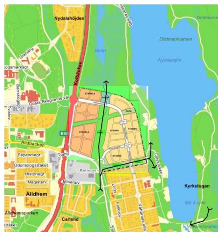
Figur 3. Ekologiska korridorer med översiktsplanen som bakgrund.

Nuvarande skogsområde, som skulle ingå i en sådan framtida grön korridor, saknar ej heller helt naturvärden, framförallt delen längst i väster ut närmast Tomtebovägen, med ett äldre djupt krondike och även växtlighet med gråal, vilket vitnar om att området tidigare varit försumpat, med de naturvärden som kan förknippas med en sådan miljö. Skogsbruket har under en längre tid haft ringa inverkan i området. Bl.a. finns en hel del döda och i kullfallna träd.