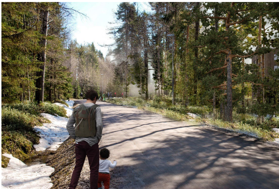
Illustration med vy från Olle fiskares väg där den nya bebyggelsen kan skimras till höger, White arkitekter

I samrådet var skogen mot Olle fiskares väg inte med i detaljplanen. Utifrån inkomna synpunkter har vi nu reviderat planförslaget för att planlägga för naturmark längs med Olle fiskares väg. Med naturmark menas områden för friväxande grönområden, där även mindre park-, vatten- och friluftsanläggningar och andra komplement till naturområdets användning ingår. Marken har kommunalt huvudmannaskap vilket betyder att kommunen är ansvarig för skötsel och drift enligt framtida skötselplan. Efter samrådet har också avståndet mellan den tillkommande bebyggelsen och Olle fiskares väg utökats. På bilden nedan går det att se en illustration för hur bebyggelsen kan komma att upplevas från Ollefiskares väg.