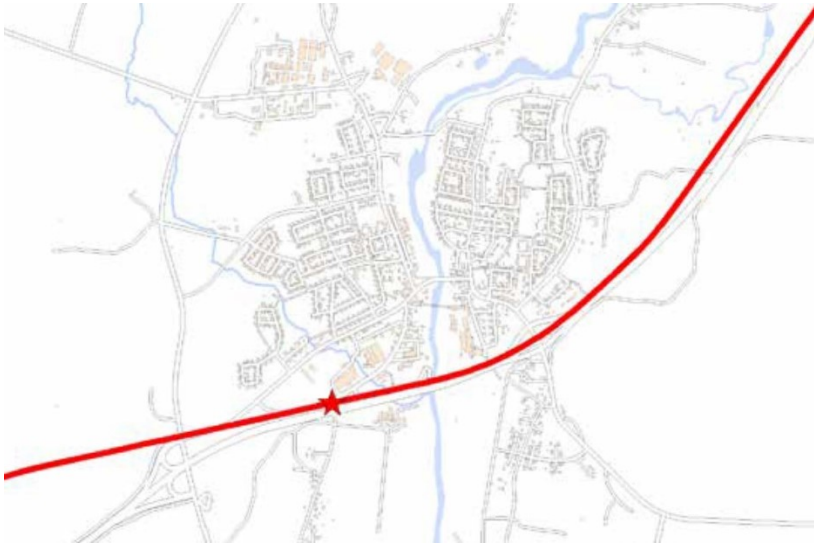
Figur 1. Karta över förordad linjesträckning (linje central) samt föreslaget stationsläge (läge A2).

Ett centralt resecentrum skapar förutsättningar för att stärka Sävars roll genom att fler ges möjlighet att bosätta sig och bedriva verksamhet i Sävar. Ett centralt placerat resecentrum, skapar även möjligheter till hållbart resande med tåg för boende i den nordöstra delen av kommunen.