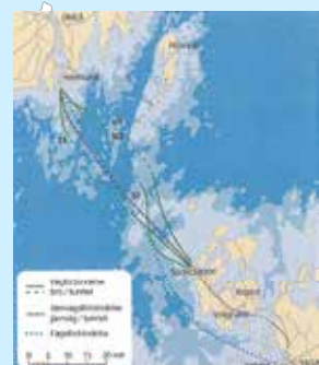
Studerade alternativ för fast förbindelse Umeå-Vasa. Karta: ÅF Infranplan