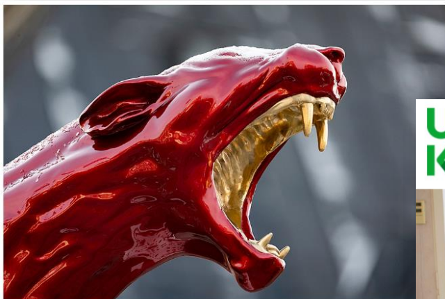
Detalj av konstverket Listen! på Rådhusorget i Umeå. © Camilla Akraha/Bildupphovs rätt 2024.