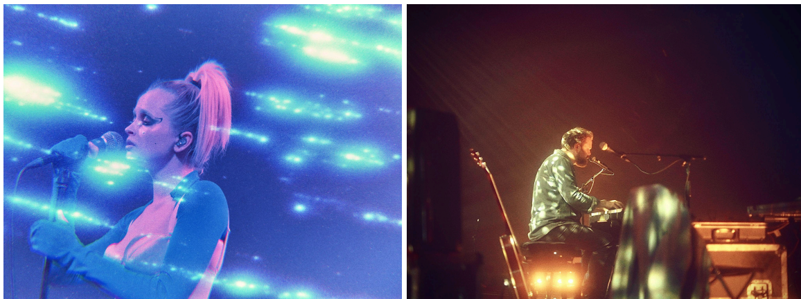
Bilder från Ditt Kvarter 2024