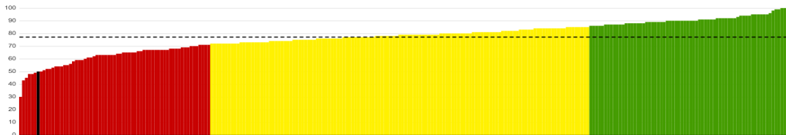
Jämförelse: Omsorgspersonalen på vardagar i boende med särskild service för äldre med adekvat utbildning, andel (%)