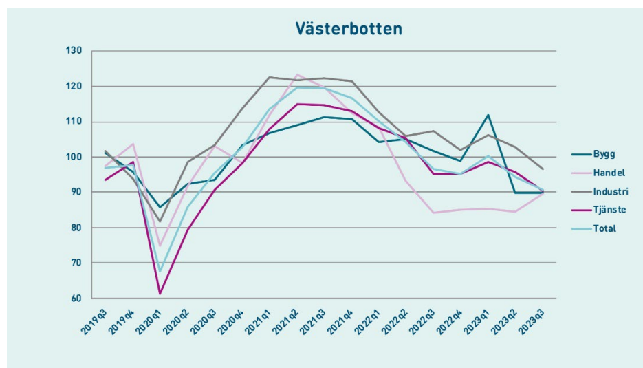
Figur 1. Konfidensindikatorn tas fram genom en företagsenkät och mäter nuläget i näringslivet samt hur företagen ser på den närmaste framtiden