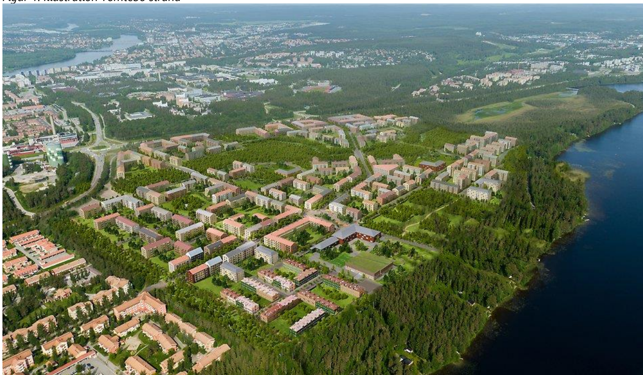
Figur 1. Illustration Tomtebo strand

Den nya stadsdelen Tomtebo strand byggs direkt norr om Stora Coop-butiken. På längre sikt, även efter 2034, kommer totalt 3 000 bostäder byggas i den nya stadsdelen via fyra etapper.